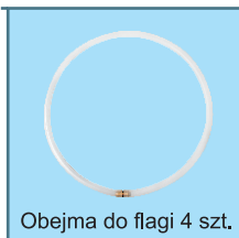
Obejma do flagi 4 szt.

Obrotowe ramię usztywniające flagę. Stała widoczność bez względu na siłę wiatru.